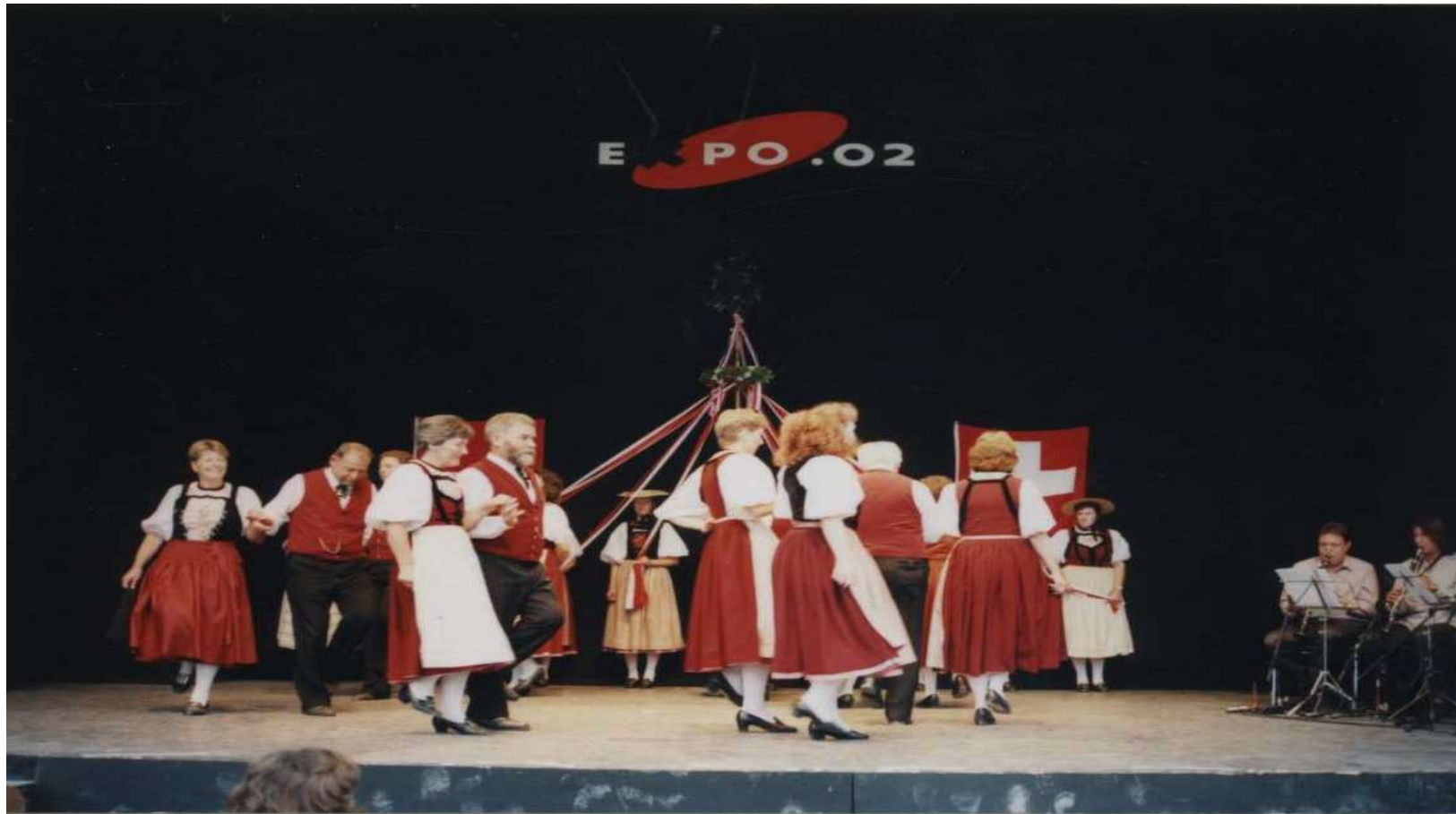
Maibaumtanz in Biel Expo 2002